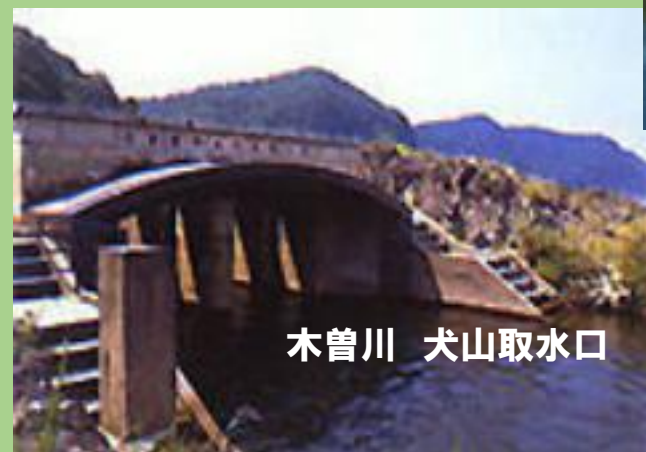
木曾川 犬山取水口