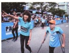
▲2017年のオレンジマラソンでは、シドニー五輪金メダリストの高橋尚子さんが参加されました。