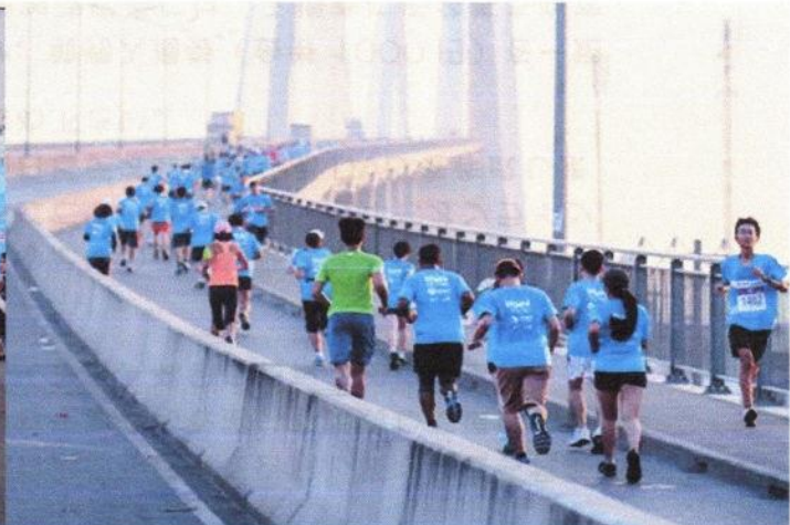
▲過去に実施したマラソンの様子