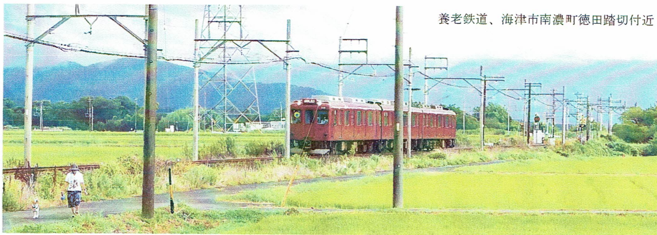
養老鉄道、海津市南濃町徳田踏切付近