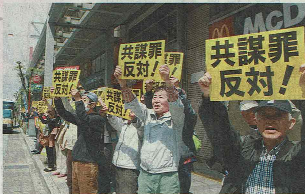
ポードを掲げて共謀罪に反対する参加者たち。岐阜市の名鉄岐阜駅前

「共謀罪」の趣旨を盛り込んだ組織犯罪処罰法改正案に反対する活動が二十九日、岐阜市の名鉄岐阜駅前であ