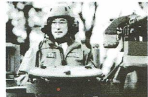
「戦時国家」つくり進める岸田首相

岸田政権のすすめる史上最大の軍拡は、2027年度までに軍事費を11兆円規模に増大させるものです。(5兆円増)