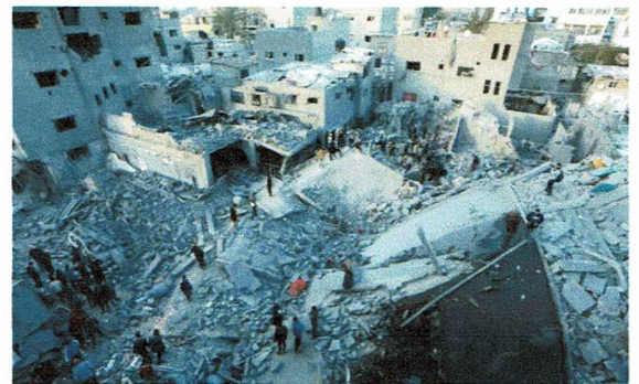
ガザ地区：面積は岐阜市の2倍弱。230万人の住民がいて周囲一切をイスラエルにより封鎖され、天井のない監獄とも云われています。この状態が75年続いています。